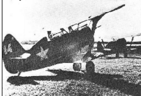
Истребитель И-15 БИС

корпуса авиации ПВО. За время Великой Отечественной войны истребительная авиация была одним из главных родов войск ПВО и основным средством борьбы с самолетами врага на дальних подступах к объектам прикрытия. Летными