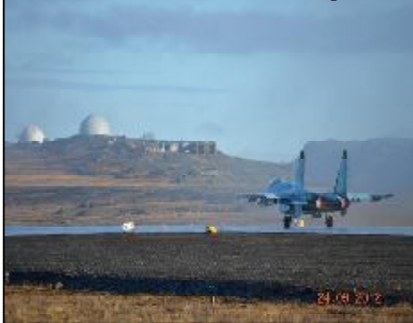
Мы - в Арктике!

В наши дни более 60 экипажей самолетов-перехватчиков несут круглосуточное боевое дежурство и могут уничтожить любой объект, который нарушил воздушное пространство России. Самолеты-перехватчики, находящиеся на вооружении истребительной авиации, охраняют наши воздушные границы от Калининграда до Камчатки и имеют возможность обеспечить перехват самолетов противника до рубежа пуска