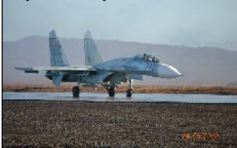
Современный истребитель - перехватчик

Як-28П, с 1987 года началось перевооружение на новые истребители Су-27. В 1993 году полк был перебазирован на аэродром Африканда в Мурманскую область и регулярные полеты истребителей над нашим архипелагом прекратились.