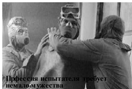
Профессия испытателя требует немало мужества

Старшее поколение помнит, как во время выступления с высокой трибуны ООН на очередном витке "холодной войны" Хрущев вошел в раж - стуча своей туфлей по трибуне, советский лидер заявил: "... мы еще покажем вам кузькину мать!" Высокое собрание наций так и не поняло, что такое "мать Кузьмы" (так озвучили термин растерявшиеся ооновские переводчики). Но трезвые головы сообразили: есть в СССР что-то