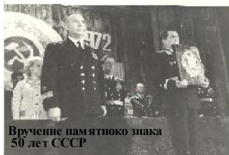
Вручение памятного знака 50 лет СССР

Яркой страницей в истории Новой Земли вписан подвиг строителей и испытателей нашего полигона, участников создания ядерного потенциала России. Днём его рождения принято считать 17 сентября 1954 года, когда была подписана директива Главного штаба ВМФ со штатной структурой войсковой части 77510.