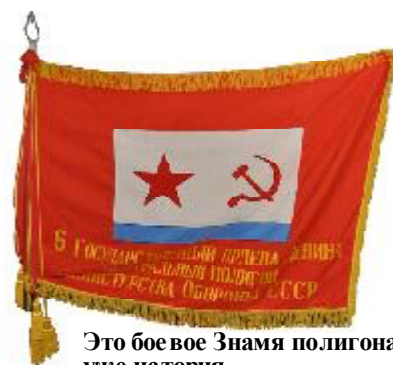
Это боевое Знамя полигона-уже история

Всего в период активной деятельности Новоземельского полигона с 21 сентября 1955 г. было произведено 132