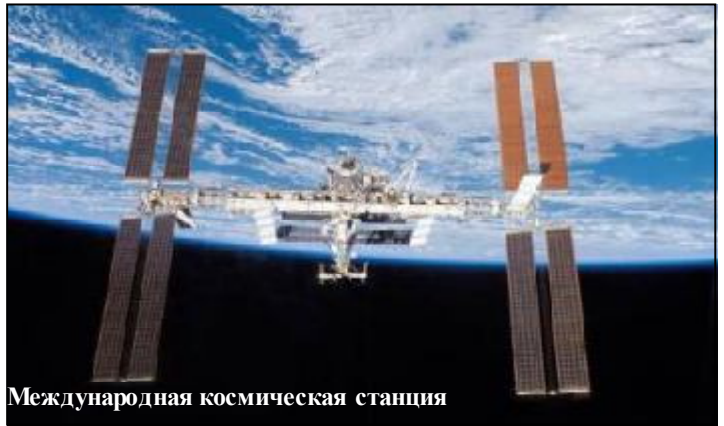
Международная космическая станция

Развитие космоса стало столь стремительным, что его достижения вошли и в нашу повседневную деятельность. Так с каждым днем все более расширяется сфера прикладного использования космонавтики. Это, прежде всего, служба погоды, навигация, спасение людей и спасение лесов, всемирное телевидение, всеобъемлющая связь, сверхчистые лекарства и еще многое-многое другое.