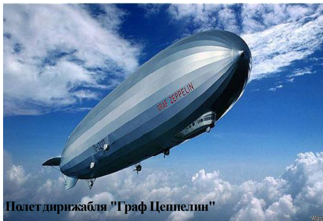
Полет дирижабля "Граф Цеппелин"

дирижабля была проделана колоссальная научная и исследовательская работа. Всего за неполные 5 суток (точнее, за 106 летних часов) был собран материал для будущих точных географических карт труднодоступных полярных районов Центральной Арктики. Да еще каких! По