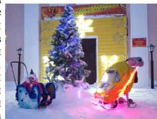
Наш корр. Лейсан САФИКАНОВА