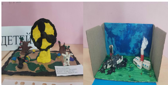
Наш корр. Людмила ШКАРУПА, фото автора.