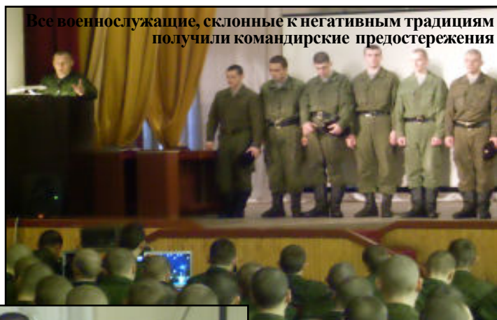
Все военнослужащие, склонные к негативным традициям получили командирские предостережения

25 марта 2012 года на Центральном Полигоне Российской Федерации прошел единый день правовых знаний на тему: "Уголовная ответственность военнослужащих за посягательство на жизнь, здоровье, честь и достоинство сослуживцев. Дружба и войсковое товарищество – залог успешного выполнения поставленных задач перед воинским коллективом", в ходе