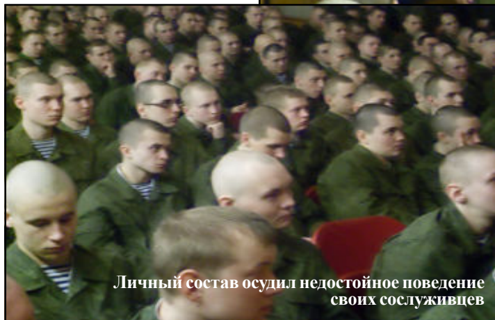
Личный состав осудил недостойное поведение своих сослуживцев

Причин происходящему называется множество, однако, бесспорно одной из них можно назвать снижение духовного и нравственного фактора в становлении и воспитании молодых людей. Так падение моральных устоев в 90-х годах, усиленное политическим и экономическим кризисом, вылилось в рост преступности, захлестнуло волной безнравственности,