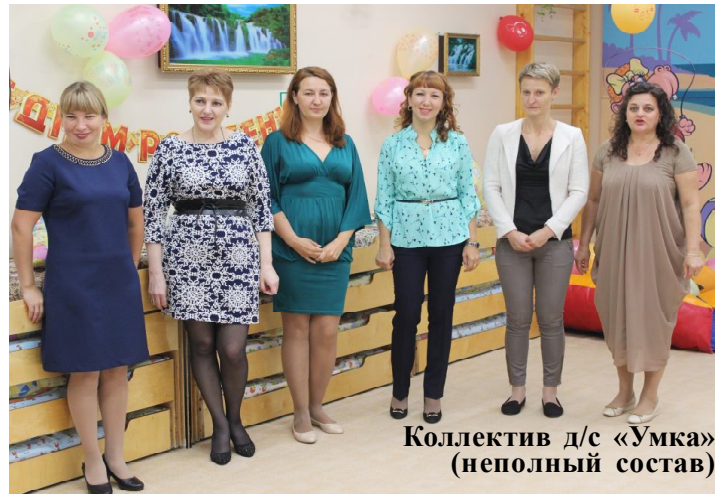
Коллектив д/с «Умка» (неполный состав)

Редакция газеты "Новоземельские вести" поздравляет с профессиональным праздником всех работников дошкольных учреждений! Выражаем огромную благодарность всем воспитателям, которые день ото дня, не смотря ни на что, отдают детям свое тепло, заботу и любовь! Мы уверены, что Ваша доброта и педагогическое мастерство превратят каждый день воспитанников детского сада в день радости и счастья!