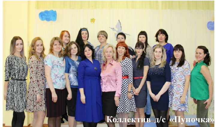
Коллектив д/с «Пуночка»

Вернуть нас в прекрасное детское прошлое помогут фотографии с того периода жизни, либо звонок детсадовскому другу, а может и родителям, которые смогут восстановить в памяти те прекрасные моменты нашей жизни. Это лишний повод улыбнуться, окунуться, пусть и на мгновение, но в маленький мир детства. Все-таки отличное было время, и, вполне возможно, каждого из нас также помнит человек, который отдал нам часть своего сердца.