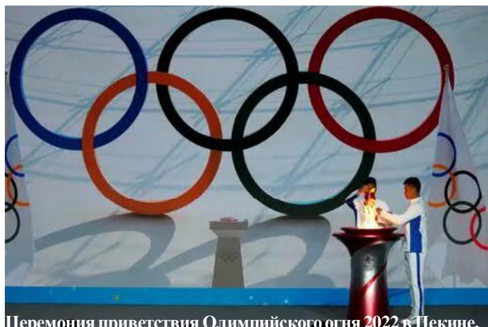
Церемония приветствия Олимпийского огня 2022 в Пекине.

- пять олимпийских колец. Форма букв передаёт характерные черты китайской техники вырезания украшений из бумаги.