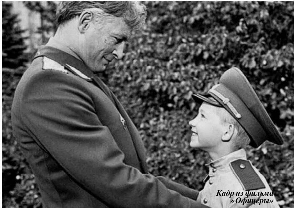
Кадр из фильма «Офицеры»

Для русского офицера делом чести было идти в бою впереди солдат, быть им примером. В русско-японской войне 1904-1905 гг. было убито и ранено 45% офицерского состава. Огромные потери,