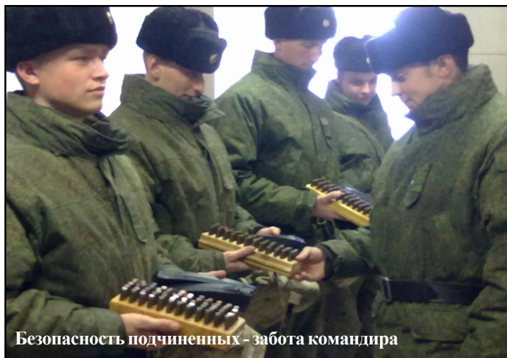
Безопасность подчиненных - забота командира

Сегодня на полигоне выработана тщательно реализуемая собственная система мер, направленная на обеспечение безопасности военнослужащих и населения гарнизона с учетом природно-климатических факторов. Внедрение ее требований в повседневную деятельность военнослужащих и гражданского персонала является неотъемлемой задачей ежедневной работы командиров и начальников всех степеней.