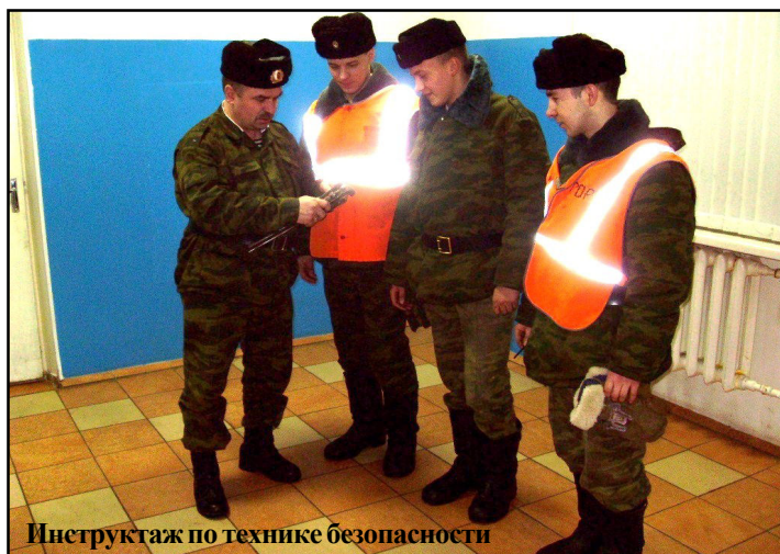
Инструктаж по технике безопасности

Поэтому работа должностных лиц воинских частей и подразделений по умелой организации повседневной деятельности личного состава, предупреждению гибели и увечий военнослужащих выдвинулась на первый план. В сложившихся специфических условиях способность к эффективному решению задач обеспечения безопасности военной службы стала, по сути, одним из важнейших критериев деловой зрелости каждого командира (начальника) любого ранга и органа военного управления.