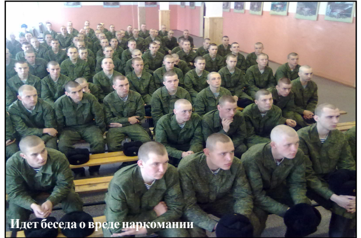
Идет беседа о вреде наркомании

Наркомания как социальное явление, имеющее тенденцию роста в армии и на флоте, пока не достигла критического уровня. Однако недооценивать ее опасность нельзя. Поэтому работа по противодействию наркомании, получившая новый импульс в ходе проведенного в июне месячника «Армия против наркотиков» будет проводиться