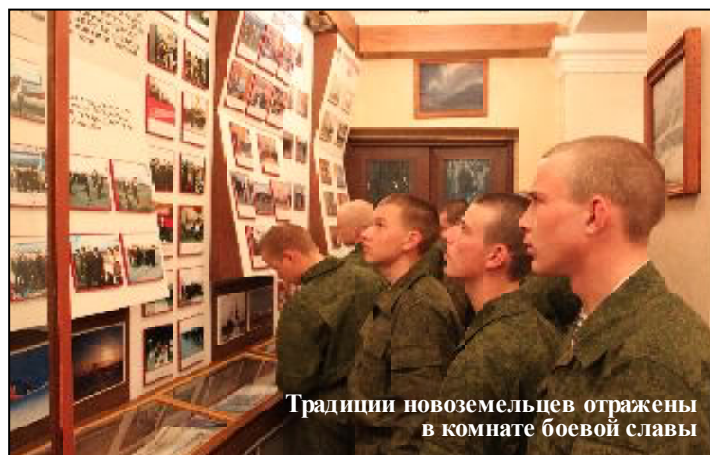
Традиции новоземельцев отражены в комнате боевой славы

Мало было обнаружить места утечки теплоносителя, замерзания водопровода или короткого замыкания кабеля. Особенно тяжело это под многометровым слоем снега, в тех местах, где нельзя применить дорожную или иную технику. Приходилось вручную лопатами рыть в снегу ямы, которые мгновенно засыпались снегом ветром ураганной силы. Кроме этого необходимо было подтащить к месту аварии технику - сварочные агрегаты, ремонтные машины электросети. Времени на устранение аварий отводилось очень мало - вода в трубах застывала через 2-3 часа после выключения насосов. Не спасала никакая изоляция. А искать место, пробиваться к нему приходилось иногда по несколько часов. Двигатели автомашин, бульдозеров, грейдеров работали сутками непрерывно. Топливо приходилось подвозить и заливать канистрами. Личный состав воинских подразделений вступал в настоящий бой, наверное, с самым сильным противником - со стихией. Их с гордостью