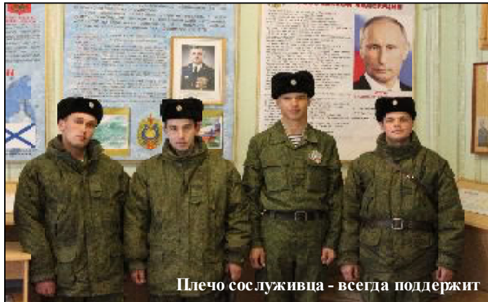
Плечо сослуживца - всегда поддержит

Служба на Новой Земле всегда требовала от военнослужащих внутренней спаянности в крепком и едином военном организме. С момента создания полигона каждый солдат и офицер по-настоящему мог осознавать свою значимость только в составе воинского коллектива, в котором он был одним из членов большой и дружной семьи.