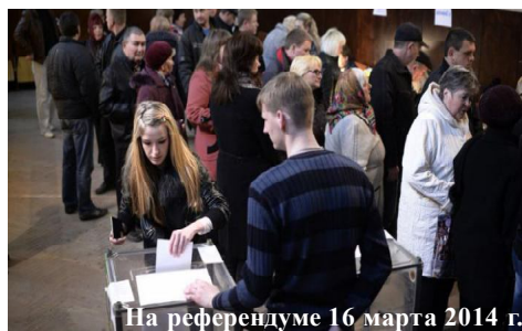
На референдуме 16 марта 2014 г.

Возвращение Республики Крым в родную гавань стало поистине масштабным событием. Подавляющее число крымчан почти двадцать три года мечтали о воссоединении с российским народом. Для граждан России Крым - это слава великих предков екатерининской эпохи, героическая история Севастополя - символа мужества и стойкости русских моряков и, конечно, всесоюзная (еще во времена СССР) здравница, на лазурных берегах которых отдыхали миллионы граждан нашей страны. Присоединение Крыма к России произошло еще 8 апреля 1783 года, тогда это событие было закреплено манифестом императрицы Екатерины II. С тех пор история полуострова неразрывно связана с Россией. И даже включение Крыма в 1954 году в состав Украинской республики носил формальный характер, ведь это произошло в составе одного государства, как тогда считалось единого и неделимого Советского Союза. Но и тогда неразрывные нити духовно-культурного единства большинства