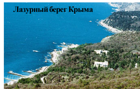
Лазурный берег Крыма

Нашей редакцией был проведен небольшой опрос на тему воссоединения России и Крыма. Ответы были разными, но стоит отметить, что все сошлись в едином мнении, что была восстановлена историческая справедливость. Что касается плюсов и минусов, то опрошиваемые отметили следующее: "Сильное подорожание цен на