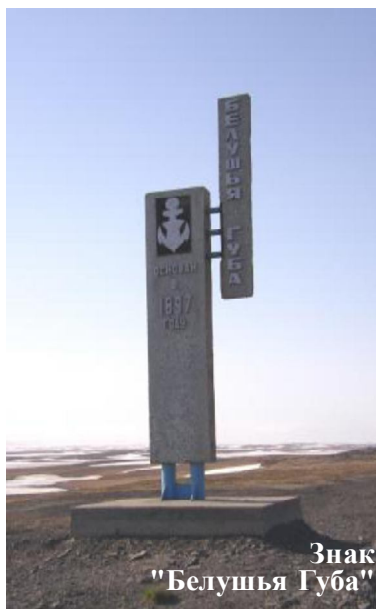
Знак "Белушья Губа"

Через суровые, а порой и экстремальные заполярные условия жизни в Арктике, на островах Новая Земля Северного ледовитого океана прошло много людей, каждый из них оставил на островах частичку своего сердца, у каждого остались об этом времени свои впечатления и воспоминания. Практически все, кто бывал на Новой Земле после 50-х годов прошлого века, уверен, полюбили этот небольшой военный городок, помнят и любят его сегодня. Не случайно в начале нового XXI столетия в Москве была создана Межрегиональная общественная организация "Московский союз новоземельцев", а ее Объединенный Совет образован в Белушьей Губе.