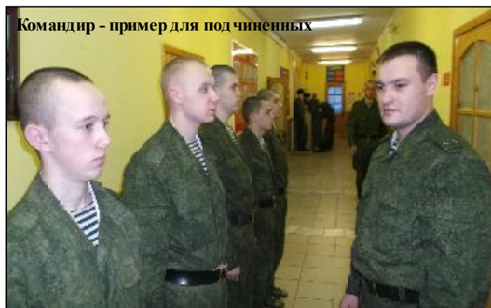
Командир - пример для подчиненных

лицам подразделений всех степеней, которые несут непосредственную ответственность за своих подчиненных. Ведь еще при первом знакомстве со своим "отцом-командиром" они сразу оценивают его, начиная с внешнего вида и заканчивая уровнем его профессиональных навыков и качеств. И это не случайно. Во все времена командиры всегда были и остаются в центре внимания своего воинского коллектива. Именно от его практических шагов зависит уровень боевой готовности и слаженности подразделения, а также правопорядка, воинской дисциплины и морально-психологического состояния личного состава. Поэтому, его умение и способность соотносить свои практические действия с их результатами является одним из основных критериев успеха действенной работы с подчиненными. Обычно о таких начальниках судят как о зрелых и опытных командирах. А такие качества сами по себе не появляются, а формируются только в продуктивной и напряженной ратной деятельности.