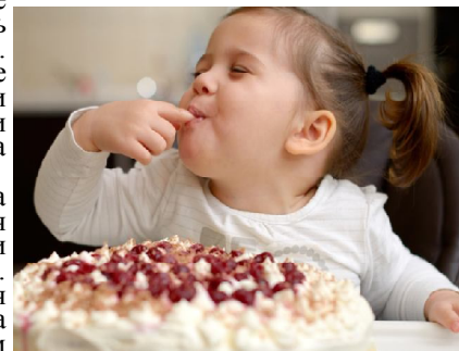
Подготовила Наталья ЗИНЧУК