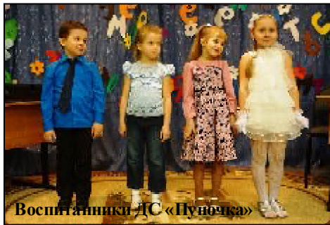
Воспитанники ДС «Пуночка»

День смеха, пожалуй, один из немногих праздников, который никогда не был признан официально, и, тем не менее,