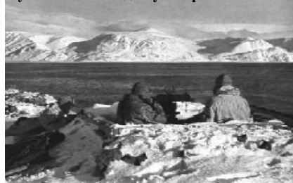
Пулеметное гнездо Губа Крестовая