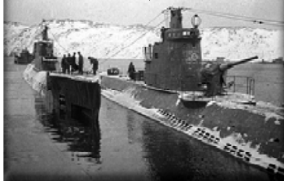
Подводная лодка США-422