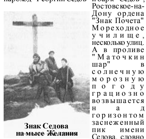
Знак Седова на мысе Желания

Хотя цели экспедиции не достигла, в Петроград доставили богатейшие научные результаты похода Седова, которые используются до сих пор. В честь Георгия Седова названы, ледокольный пароход "Георгий Седов" и барк "Седов", Ростовское-на-Дону ордена "Знак Почета" Мореходное училище, несколько улиц.