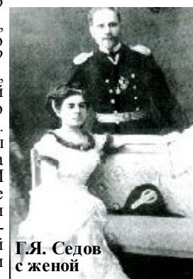
Г.Я. Седов с женой