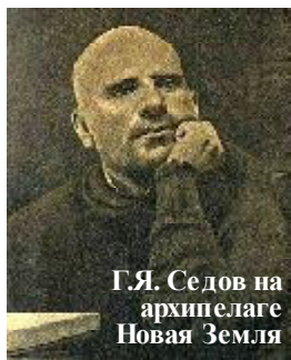
Г.Я. Седов на архипелаге Новая Земля

В конце августа 1914 года к становищу Рында на Мурмане подошло странное судно. Верхняя часть бортов его была разрушена. На останках мачт в и с е л и потрепанные ш т о р м а м и паруса. На неприбранной палубе стояли давно не мытые бородатые люди в обветшалой одежде.