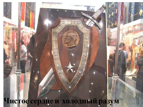
Чистое сердце и холодный разум