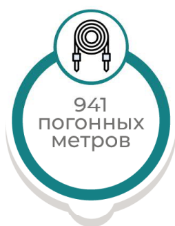
Кабель для электропитания здания (10 кВ)