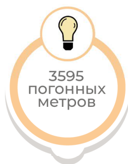
Кабель для электроосвещения здания (0,4 кВ)