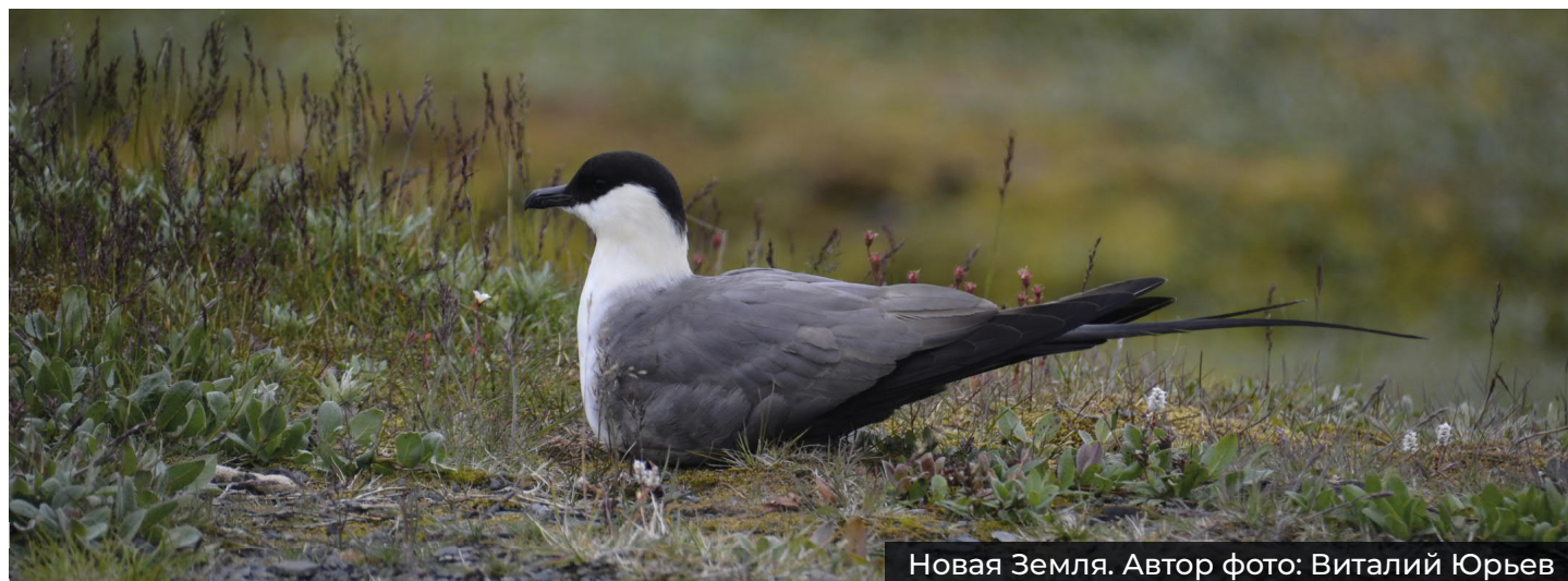
Новая Земля.