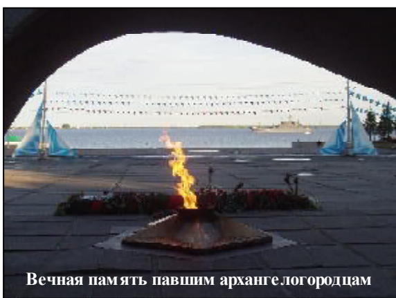
Вечная память павшим архангелогородцам

Важнейшей проблемой военной перестройки с первого дня войны стала проблема кадров. Решить ее в тех условиях было возможно лишь за счет увеличения рабочей смены. Указом Президиума Верховного Совета СССР от 26 июня 1941 г. руководителям на местах разрешалось увеличивать рабочий день на три часа. Для 19 тысяч рабочих архангельских лесозаводов это было равнозначно получению 7 тысяч квалифицированных производственников, т.е. почти полной