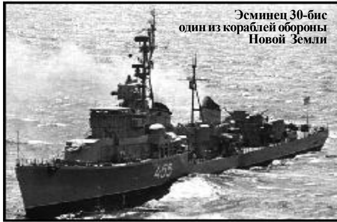
Эсминец 30-бис один из кораблей обороны Новой Земли

Вице-адмирал, Председатель Межрегиональной общественной организации "Московский союз новоземельцев", НШ - Начальник ЦП РФ (1992-1997 гг.), член Союза писателей России В.С.ЯРЫГИН