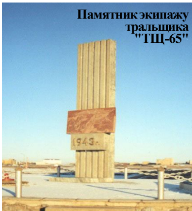
Памятник экипажу тральщика "ТЩ-65"