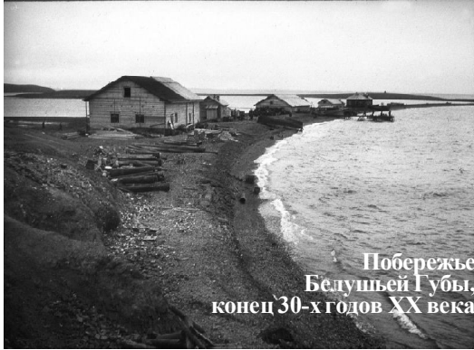
Побережье Белушья Губы, конец 30-х годов XX века

К середине 1941 года, благодаря помощи страны и постоянной напряженной работе жителей, Белушья Губа выросла и обустроилась. К ш е с т и помещениям в с т а н о в и щ е д о б а в и л о с ь ч е т ы р ь н а д ц а т ь построенных домов, из них три жилых - это п о м е щ е н и е о с т р о в н о г о интернат, лазарет,