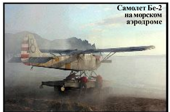
Самолет Бе-2 на морском аэродроме