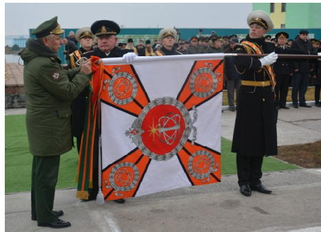
Ленина, ордена Суворова полигона Российской Федерации. Событие состоялось на новой площади, где был