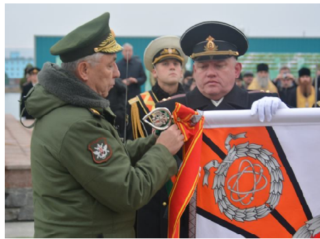
ритуалом, прикрепил орден Суворова к Боевому знамени Центрального ордена

Невозможно представить, что на месте нашей центральной площади, всего четыре года назад стояли развалины. А уже 16 сентября 2014 года, первый заместитель Министра обороны Российской Федерации генерал армии А.В. Бахин, от лица Президента Российской Федерации В.В. Путина и Министра обороны Российской Федерации генерала армии С.К. Шойгу, в соответствии с воинским