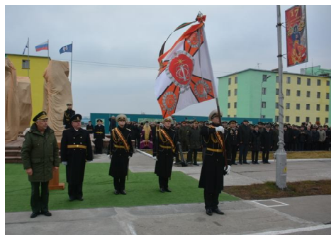
открыт монумент "Создателям ядерного щита России".

Благодаря самоотверженному труду новоземельцев, даже в нашем