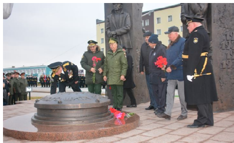
ордена Ленина полигон Российской Федерации награжден вымпелом -

01.08.2007 г.г. - За труды по укреплению духовных основ воинского служению Отечеству, Центральный