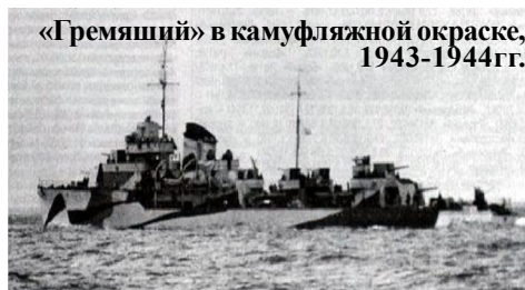
«Гремящий» в камуфляжной окраске, 1943-1944гг.