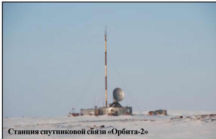
Станция спутниковой связи «Орбита-2»

Важнейшее значение радио стало приобретать и во время активного освоения арктических просторов нашего государства. Часто радиосвязь оставалась последней надеждой, что связывала полярников с "Большой землей", давала уверенность, силу и веру в благополучное выполнение задания и возвращение на Родину.