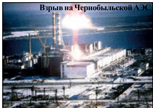
Взрыв на Чернобыльской АЭС

Двадцать шесть лет назад произошло трагическое событие на Чернобыльской АЭС, повергшее в шок весь мир. Отголоски этой катастрофы века еще долго будут бередить души людей, а ее последствия еще не раз коснутся человека.