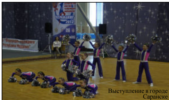
Выступление в городе Саранске