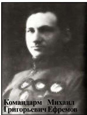
Командарм Михаил Григорьевич Ефремов

В октябре 1941 года Генерал-лейтенант М. Г. Ефремов был назначен командующим 33 армией. 17 января 1942 года из штаба фронта поступил приказ: 33-й армии наступать на Вязьму и овладеть этим важным стратегическим узлом. Прорыв был удачным. На санях и лыжах бойцы обходили немецкие гарнизоны и громили их с фронта и тыла. Передовые отряды, не