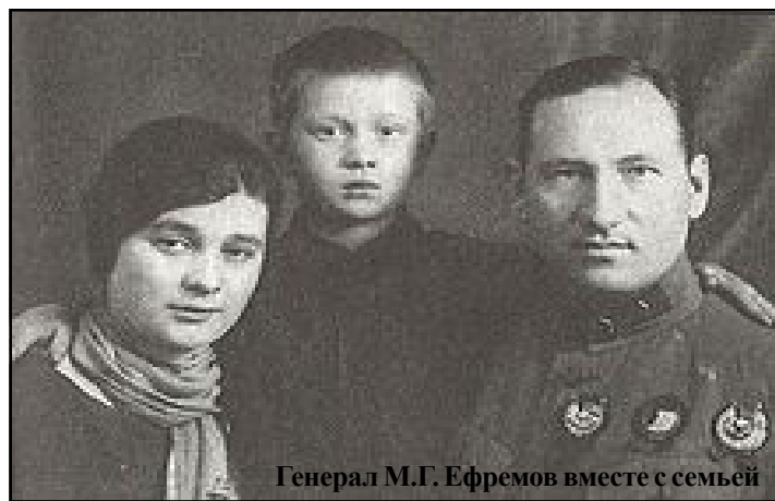
Генерал М.Г. Ефремов вместе с семьей

С вечера 13 апреля всякая связь со штабом 33-й армии теряется. Отдельные её части пробиваются на восток разрозненными группами. 19 апреля 1942 года в бою командарм М. Г. Ефремов, сражавшийся как настоящий герой, был тяжело ранен (получив три ранения) и, не желая попасть в плен, когда обстановка стала критической, вызвал свою жену, служившую