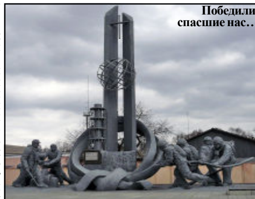
Победили, спасшие нас...

Еще в 1922 г академик В.И.Вернадский предупреждал, что время овладения атомной энергией близко, и главный вопрос заключается в том, как человечество употребит этот колоссальный источник энергии - для роста своего благосостояния или для самоуничтожения. Создание в последующем ядерного оружия массового поражения и аварии на промышленных объектах атомной энергетики, в том числе происшедшей год назад катастрофы на Фукусимской АЭС на территории Японии показывают актуальность предупреждения ученого.