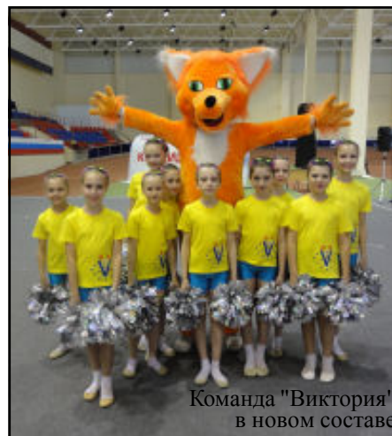
Команда "Виктория" в новом составе

Команда соревновательного черлидинга "Виктория" ШДТ "Семицветик" заняла второе место на Международном турнире по черлидингу "Северная Пальмира-2012", который прошёл 7 апреля в Санкт-Петербурге.