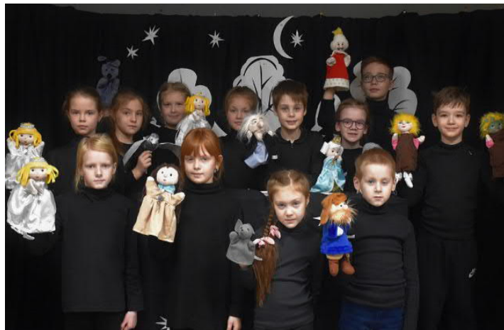
Наш корр. Лейсан САФИКАНОВА.

Спектакль смотрится на одном дыхании, а маленькие талантливые воспитанники секции создают драматическую атмосферу, заставляя сопереживать героям. Надеемся, что вложенные в постановку силы и средства сторицей окупятся в виде улыбок благодарных родителей и зрителей!