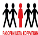
РАЗОРВИ ЦЕПЬ КОРРУПЦИИ

Далее необходимо принять участие в проведении оперативно-розыскных мероприятий, точно выполняя указания сотрудников правоохранительных органов.