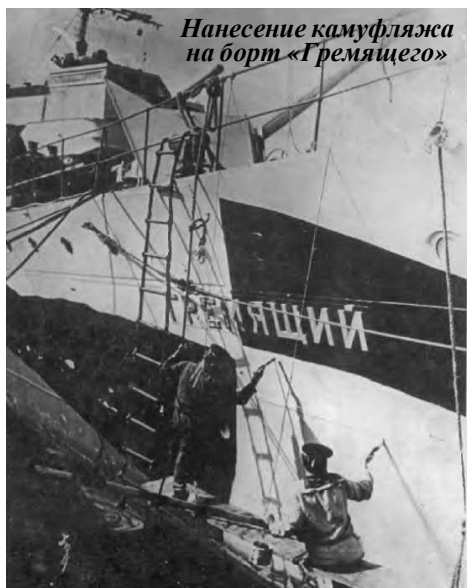
Нанесение камуфляжа на борт «Гремящего»