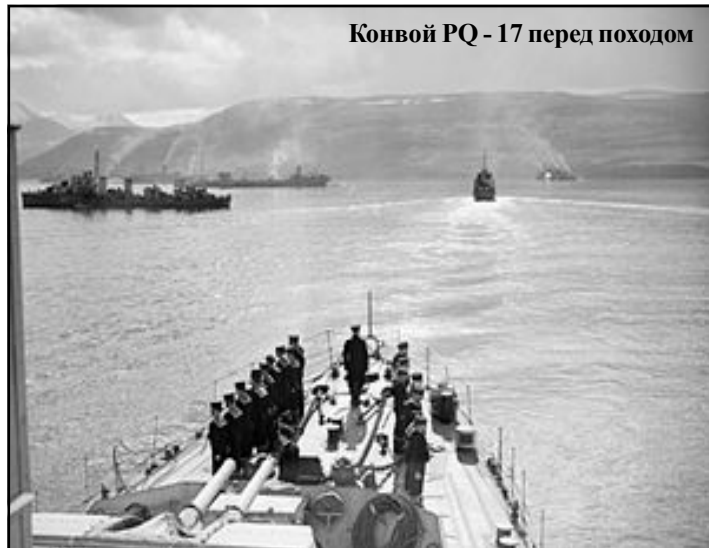
Конвой PQ - 17 перед походом

Суровые Арктические просторы, плавание в которых всегда было сопряжено с риском для экипажей морских судов, неоднократно становились ареной и военного противостояния. Ледяные северные морские пучины до сих пор хранят тайны человеческих трагедий и примеры беспримерного мужества советских, английских и американских моряков, которые отважились вступить в смертельную схватку с коварным врагом в годы Второй Мировой войны. Безмолвными свидетелями этих