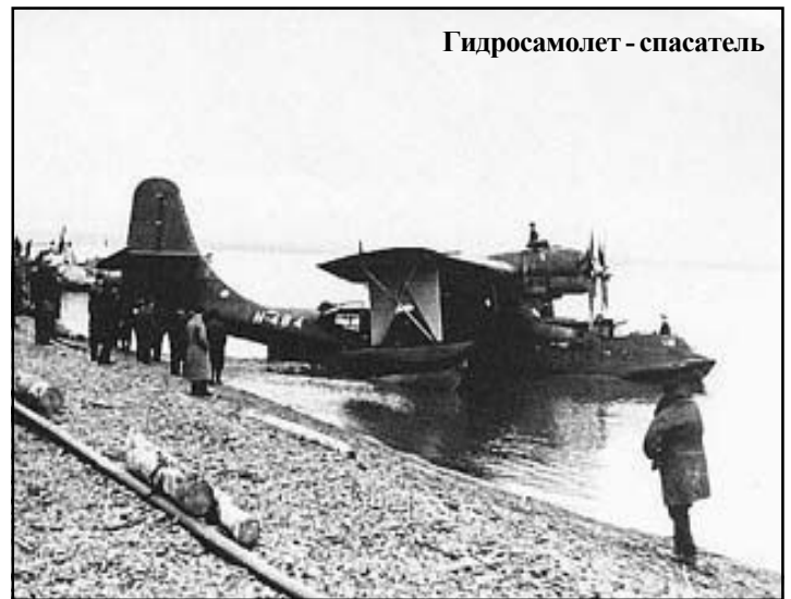
Гидросамолет - спасатель

Известен общий итог конвоя PQ-17. Из 34 транспортов, вышедших из Исландии, погибли 23 транспорта и спасательное судно, причем семь из них были добыты кораблями охраны. Вместе с ними пошли на дно 430 танков, 210 самолетов, 3350 автомашин и около 100 тыс. тонн разных военных грузов. Одиннадцать транспортов, достигших порта назначения,