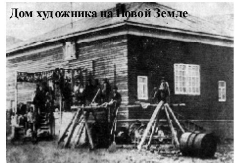
Дом художника на Новой Земле

Летом 1903 года Борисов в последний раз побывал на Новой Земле, прожив в своем доме около месяца. Потом были выставки в Европе: Вена, Прага, Мюнхен, Берлин, Гамбург, Дюссельдорф, Кёльн, Париж... Французам так понравились полотна Борисова, что он был награжден орденом Почетного легиона. Последняя выставка в Европе была в Лондоне. Затем была Америка и личный прием президента США.