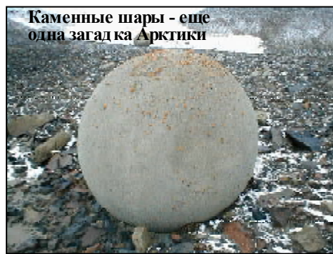
Каменные шары - еще одна загадка Арктики

Так, постоянно действующая Морская Арктическая Комплексная Экспедиция, в течение ряда лет проводящая комплексное изучение