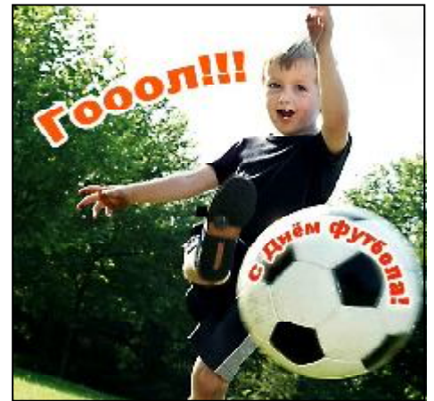
Подготовила Ирина ШЕВЧЕНКО

В последние годы стабильная ситуация в футболе (хорошая физическая подготовка спортсменов, грамотные тренеры, высокие гонорары, постоянное инвестирование) вселяет в души россиян уверенность в перспективном развитии этого вида спорта и будущих достижениях российских футбольных команд.