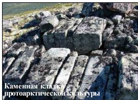
Каменная кладка протоарктической культуры

В эпоху современных научных исследований, когда на нашей планете практически не осталось неизведанных уголков, гипотеза существования земель в районе северного полюса - "Мифической Гипербореи или Арктиды" - не подтвердилась. Но остался вопрос - всегда ли северные полярные районы земли были покрыты льдами? А если нет, то были ли они населены людьми?