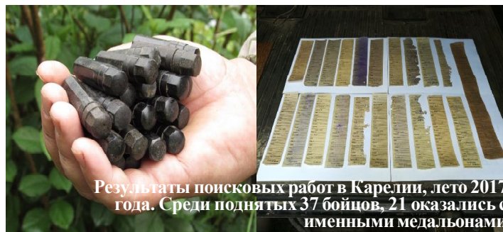
Результаты поисковых работ в Карелии, лето 2017 года. Среди поднятых 37 бойцов, 21 оказались с именными медальонами