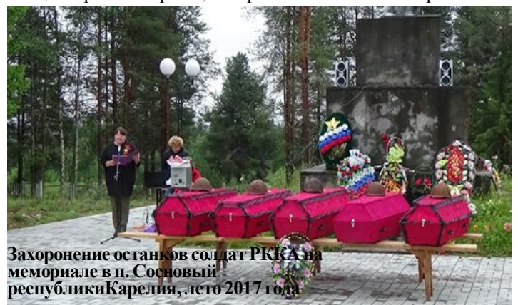
Захоронение останков солдат РККА на мемориале в п. Сосновый республики Карелия, лето 2017 года